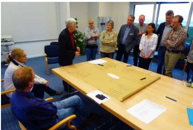
Thementisch „Wirtschaft und Tourismus“