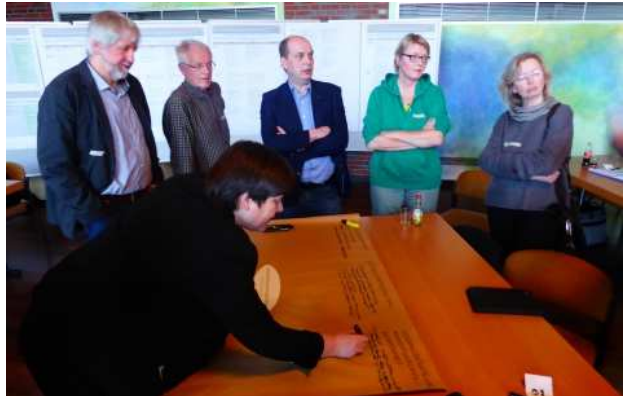
Thementisch „Ortsentwicklung und Ortsgestaltung“