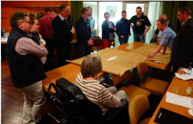
Thementisch „Soziales und Gemeinschaftliches“