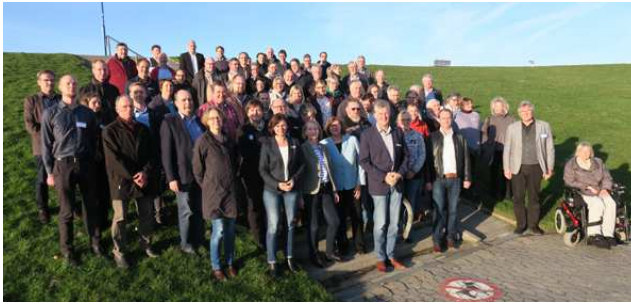
Die Teilnehmer der Veranstaltung am 24. März 2017 in Neuharlingersiel