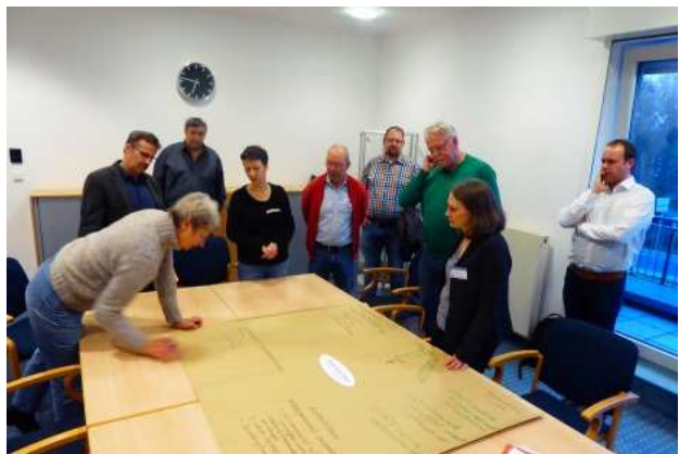
Thementisch „Übergreifende Themen“