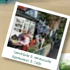
Gemütliche & romantische Restaurants & Cafés