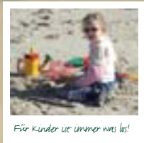
Für Kinder ist immer was los!