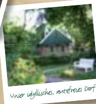
Unser idyllisches, autofreies Dorf

Weitere Informationen und Tipps für Ihren Ausflug finden Sie unter www.spiekeroog.de .